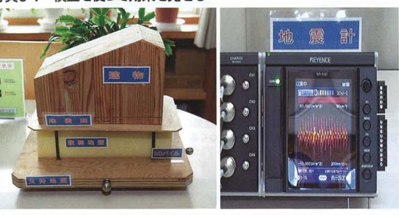
左: 合板とスポンジで作った模型 右: 支持地盤に見立てた合板を揺らした際の加速度波形。地 盤 (赤色) と比べて杭基礎がある建物 (黄色) の加速度は抑えられている